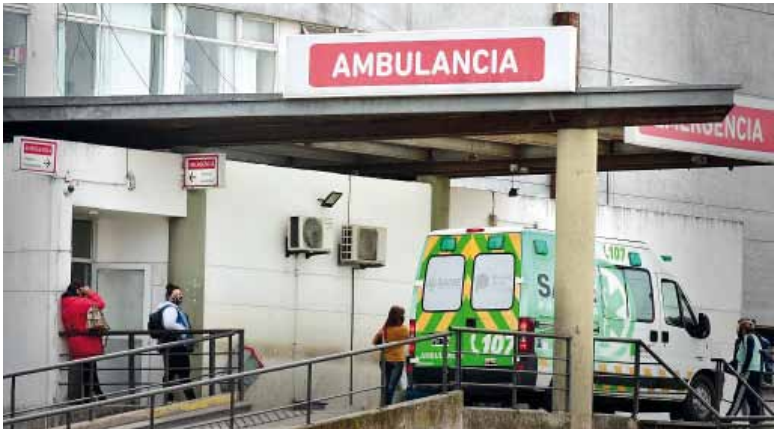
Escape fatal. La moto en la que circulaban chocó en el barrio Los Hornos.

Por otro lado, un ladrón que sustrajo una camioneta en el Puer-