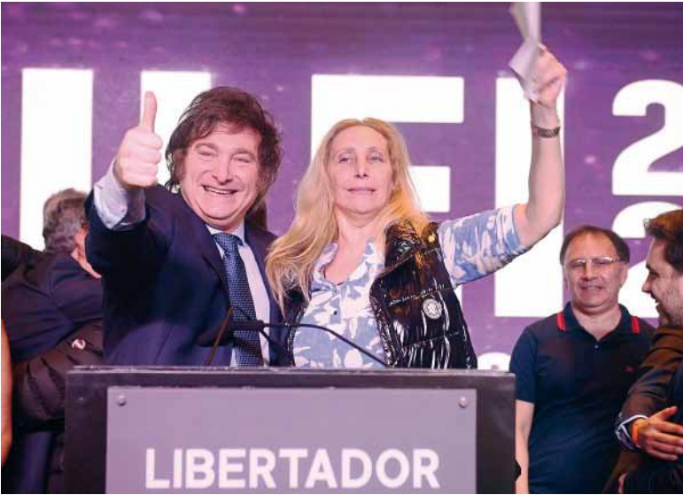
Victoria. La LLA hizo prevalecer sus condiciones, ahora también en CABA.

Las negociaciones habían tambaleado el lunes, después de que el expresidente se mostrara descontento luego de que los enviados de la secretaria general de la Presidencia quisieran “tomar una posición totalmente dominante”. “No hay definiciones”, dijo tajante en diálogo con la prensa cuando salió de la reunión partidaria.