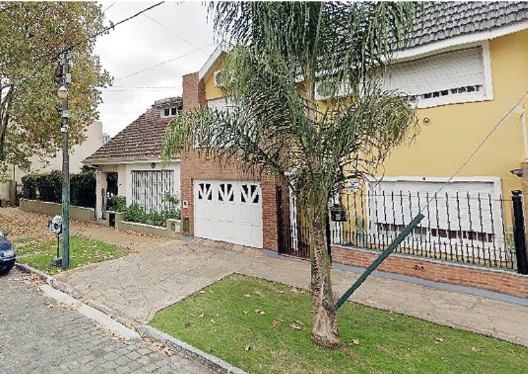
Escenario. La casa donde ocurrió el presunto filicidio, en la calle Eustaquio Díaz Vélez 192, en Lomas de Zamora.

El hombre, que tenía problemas de salud mental, intentó suicidarse y fue encontrado en un charco de sangre. La Policía ordenó su traslado al hospital Gandulfo.