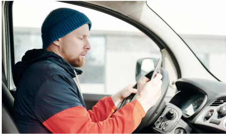
Riesgo. Gran parte de los conductores no puede evitar usar el celular mientras maneja.

Los resultados de la encuesta son reveladores: al recibir una llamada, un 41% interactúa con el teléfono: el 13,4% responde sin dejar de manejar y el 28,2% la gestiona con manos libres o altavoz. Sin embargo, el 33,4% no atiende y un