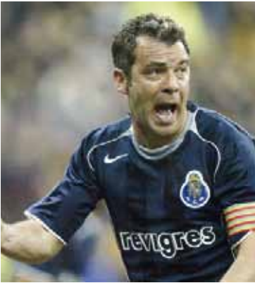
El exfutbolista portugués sufrió un paro cardíaco.

Falleció Jorge Costa, capitán campeón de Europa con Porto