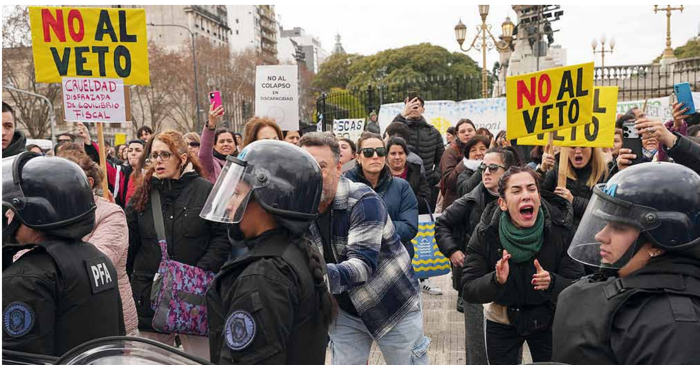
Se registraron algunos cruces entre los manifestantes y las fuerzas de seguridad en el Congreso.

tales de la lista, mientras que LLA se queda con los dos senadores. El expresidente llevó adelante las negociaciones con Karina Milei y lograron encaminarlas luego de que tambalearan el lunes. Página 3