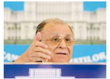
Fue el primer jefe de Estado del país balcánico tras la caída del comunismo.

Murió Ion Iliescu, el primer presidente de la Rumanía democrática