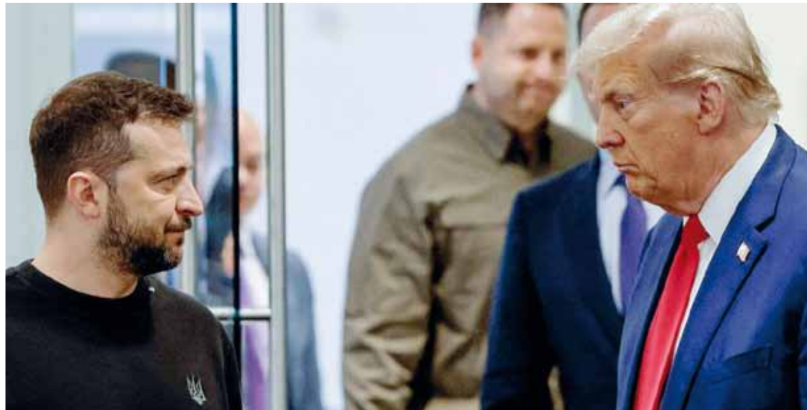
Diálogo. Los presidentes conversaron sobre posibles sanciones a Rusia, nuevos acuerdos bilaterales y la llegada de armamento financiado por países europeos.

“También hemos hablado de nuestra cooperación bilateral en defensa con EE.UU. El borrador de acuerdo sobre drones ya está preparado por lo que respecta a Ucrania, y estamos listos para hablarlo con detalle y firmarlo”, explicó Zelenski, que informó además a Trump de los últimos ataques rusos que han matado a civiles.