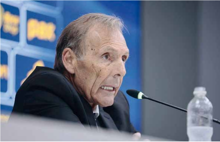
Esto es siempre Boca. “Tenés la obligación de ganar”, remarcó el director técnico.

costado personal. Russo habló de sus hijos, en especial del delantero Ignacio, que actualmente juega en Tigre: “Primero, que lo dejen tranquilo a mi hijo. Está muy bien en Tigre. No busquen cosas donde no las hay. Él habla de Tigre y de él, tiene otra mentalidad y está muy bien”.