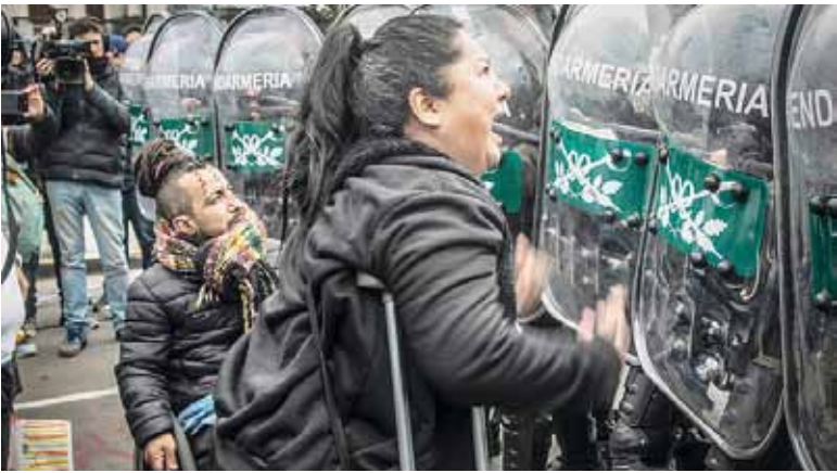
Cara a cara. Tensión en la Plaza del Congreso.

El proyecto vetado busca modificar las condiciones para acceder a las pensiones no contributi-