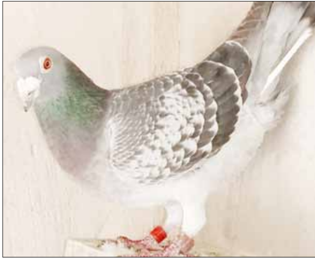
La pupila de Javier Arruza que fue la más rápida en llegar a su palomar luego de ser puesta en libertad en Santa Fe, a 515 km. de Bolívar.